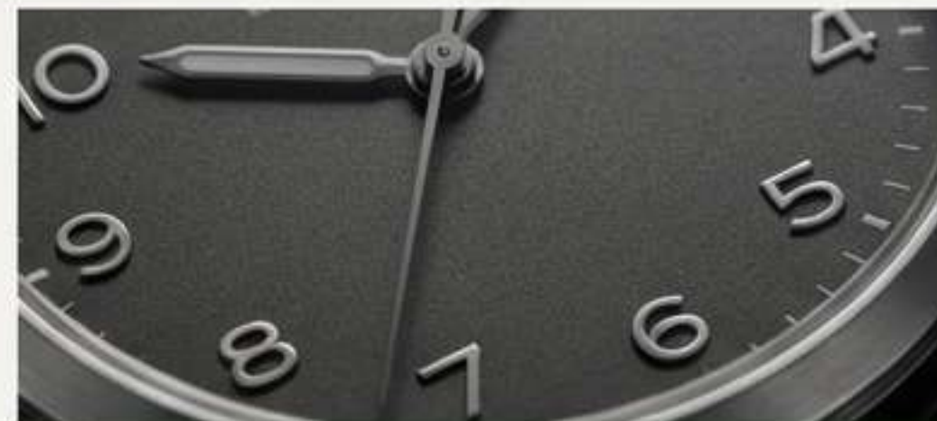
Gris Antracita: La alternativa moderna al negro. Un tono carbón con profundidad y un punto industrial-chic.