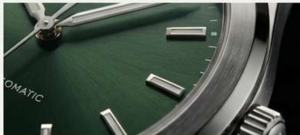
Verdes Bosque: Tonos oscuros y naturales que evocan aventura y elegancia.