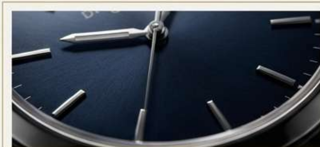
Azules Invernales: Tonos marinos profundos, casi nocturnos. Pura sofisticación.