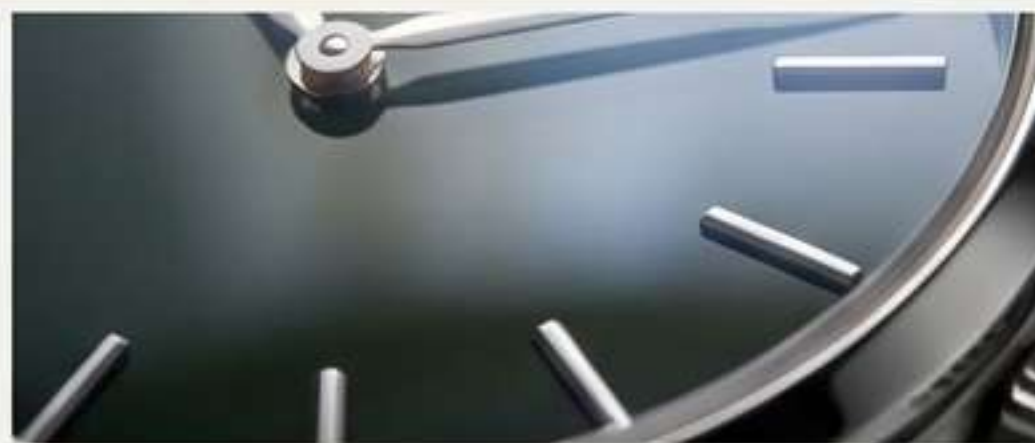
Acabado Lacado: Liso, profundo y brillante, como la superficie de un piano. Color puro y sólido.