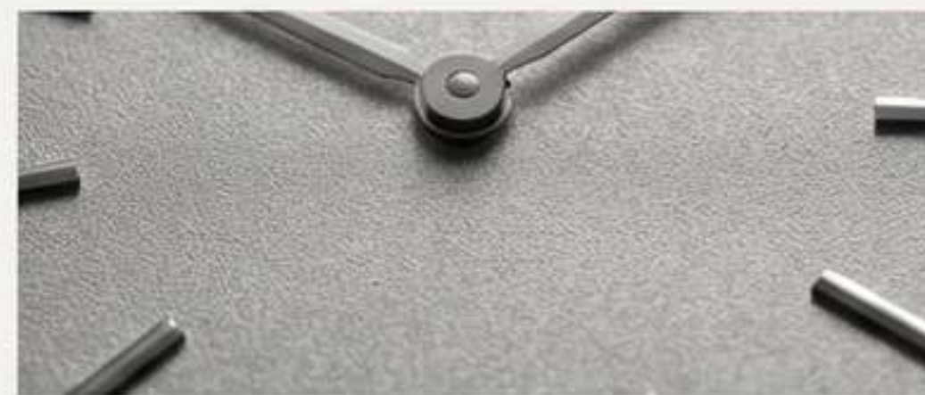
Acabado Granalla (Frosted): Texturizado y mate. Mejora la legibilidad y aporta un toque técnico y contemporáneo.