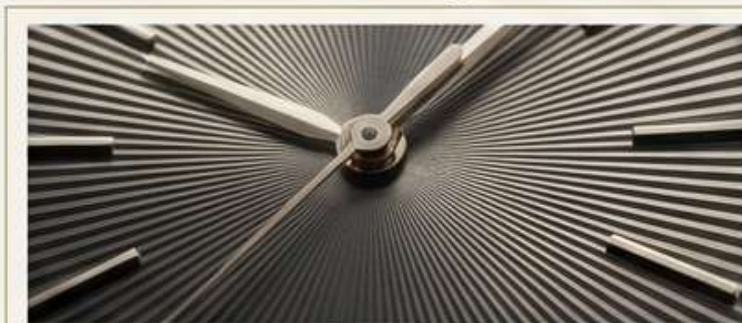
Efecto Sunburst (Rayos de sol): El más popular. Un cepillado que atrapa la luz y crea un dinamismo increíble.